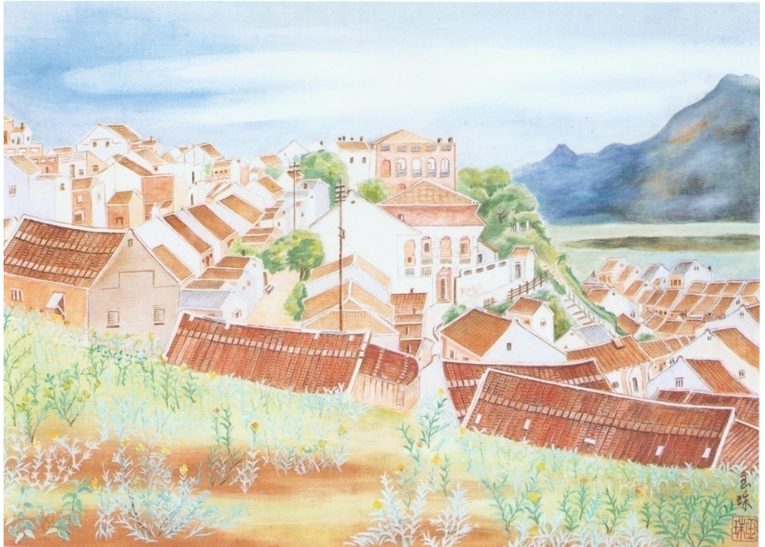
林玉珠 <西照港埕> · 1940

而決心以美術為教會服務的畫家陳敬輝，自 1932 年學成返台回到淡水後，以詩意洋溢的線條畫出淡水女性的溫柔婉約，並把一生貢獻給美術教育。他的女弟子林玉珠，以同樣的細緻筆法繪出淡水城鎮屋宇櫛比的詩情畫意。