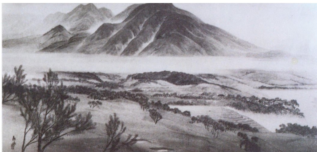
木下靜涯畫作〈滬尾之丘〉

木下淡水住處，三層厝 26 番地，位於臨河丘地樹木扶疏間，可以眺望淡水河和觀音山，木下於畫中用印稱「世外莊」，可見淡水在木下心目中的地位。木下居住淡水期間，創作不輟，其中〈風雨〉、〈霽大屯〉和〈雨後〉等畫作，都是以淡水為主題的作品。木下把淡水視為南畫意境中的桃花源，留下了許多水墨傑作，更為淡水的風景增添了氣韻氤氳的南畫之美的美感經驗。